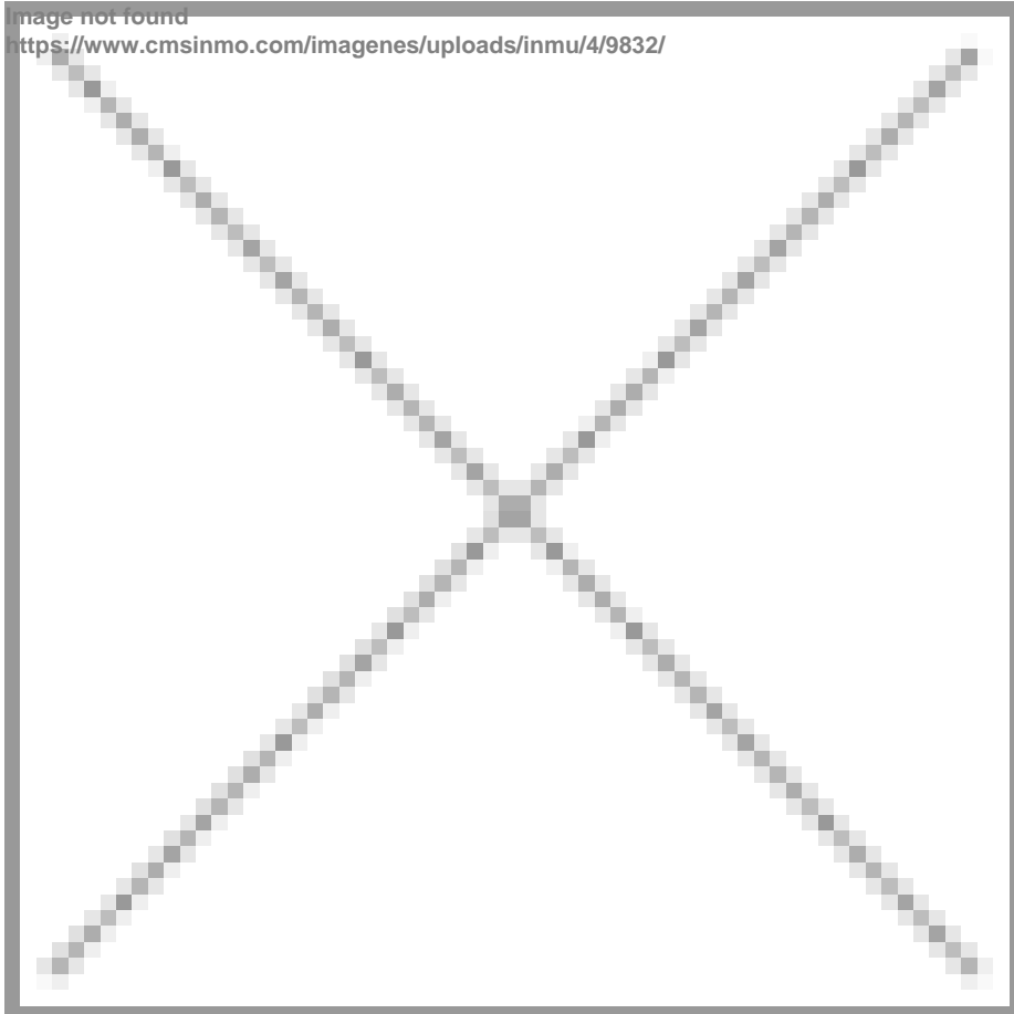
Image not found https://www.cmsinmo.com/imagenes/uploads/inmu/4/9832/