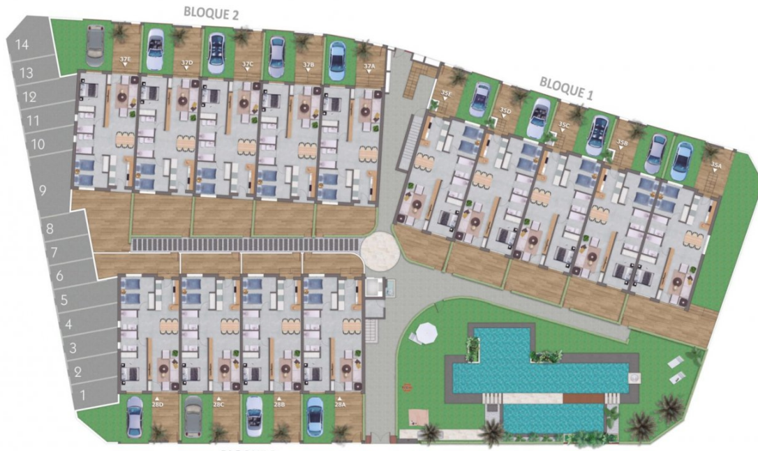
Planta Baja / Ground Floor