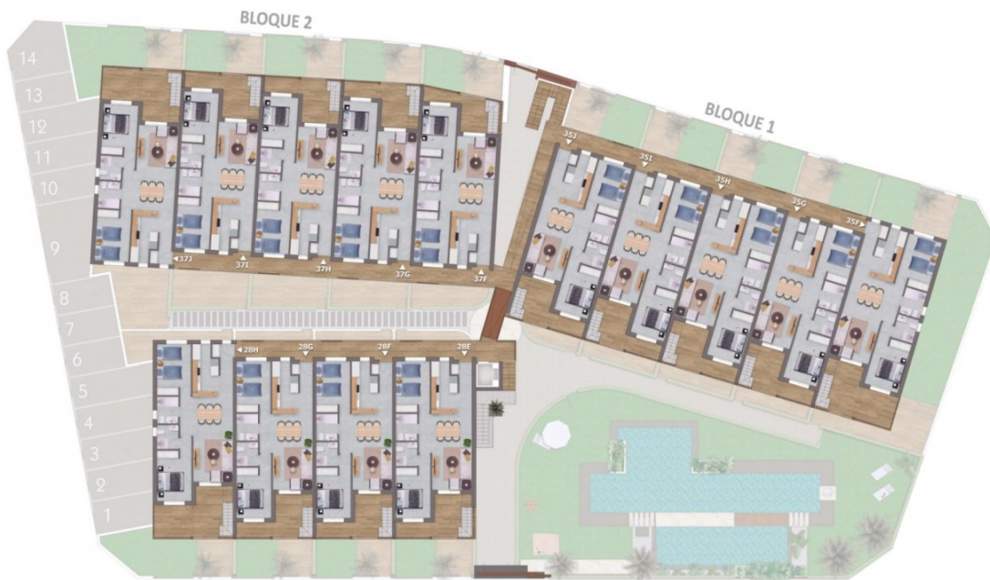
Planta Primera / First Floor