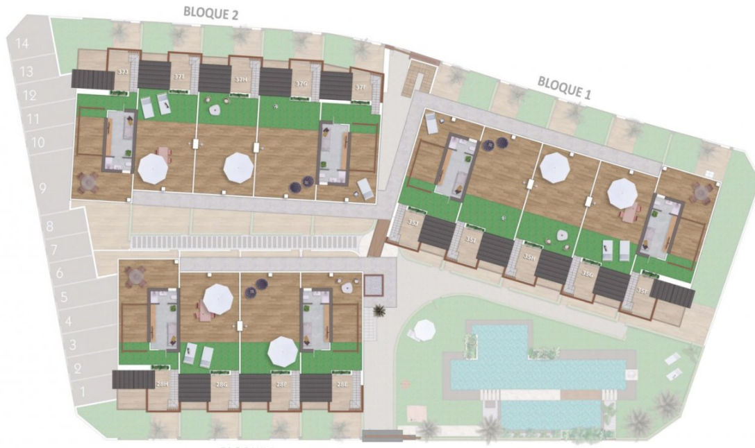
Planta Solarium / Topfloor