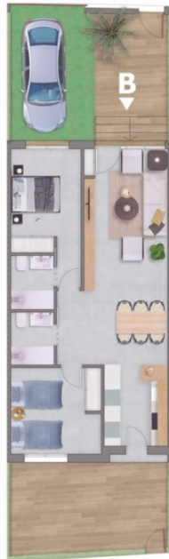
Planta baja / Ground Floor