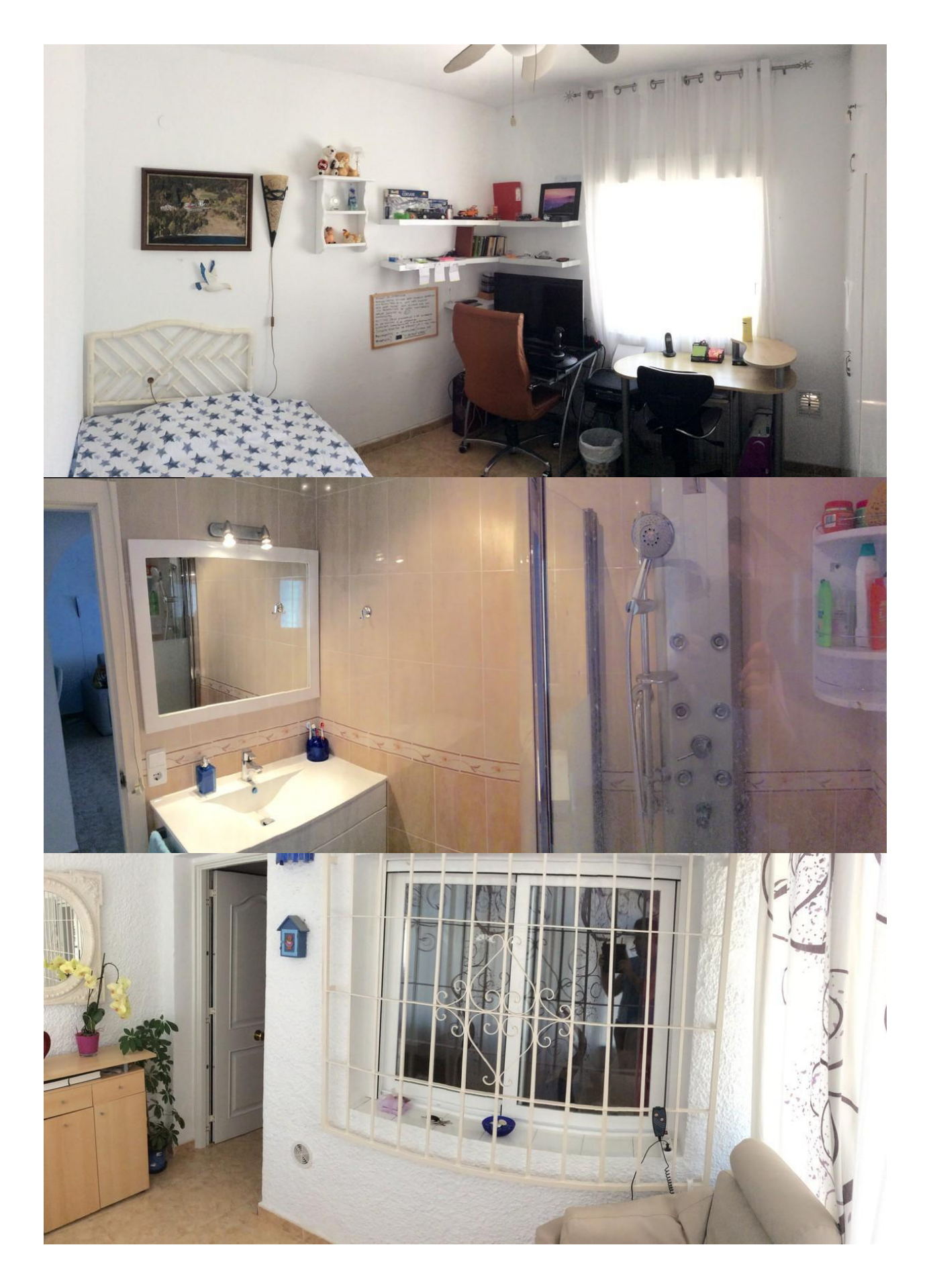
"OUR EXPERIENCE IS YOUR GUARANTEE"