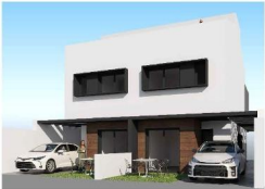
PLANO COMERCIAL PROVISIONAL. Plano sujeto a posibles modificaciones por razones o exigencias de índole técnica o jurídica.