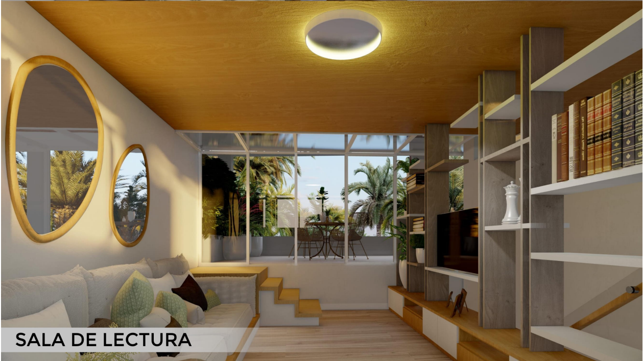
SALA DE LECTURA