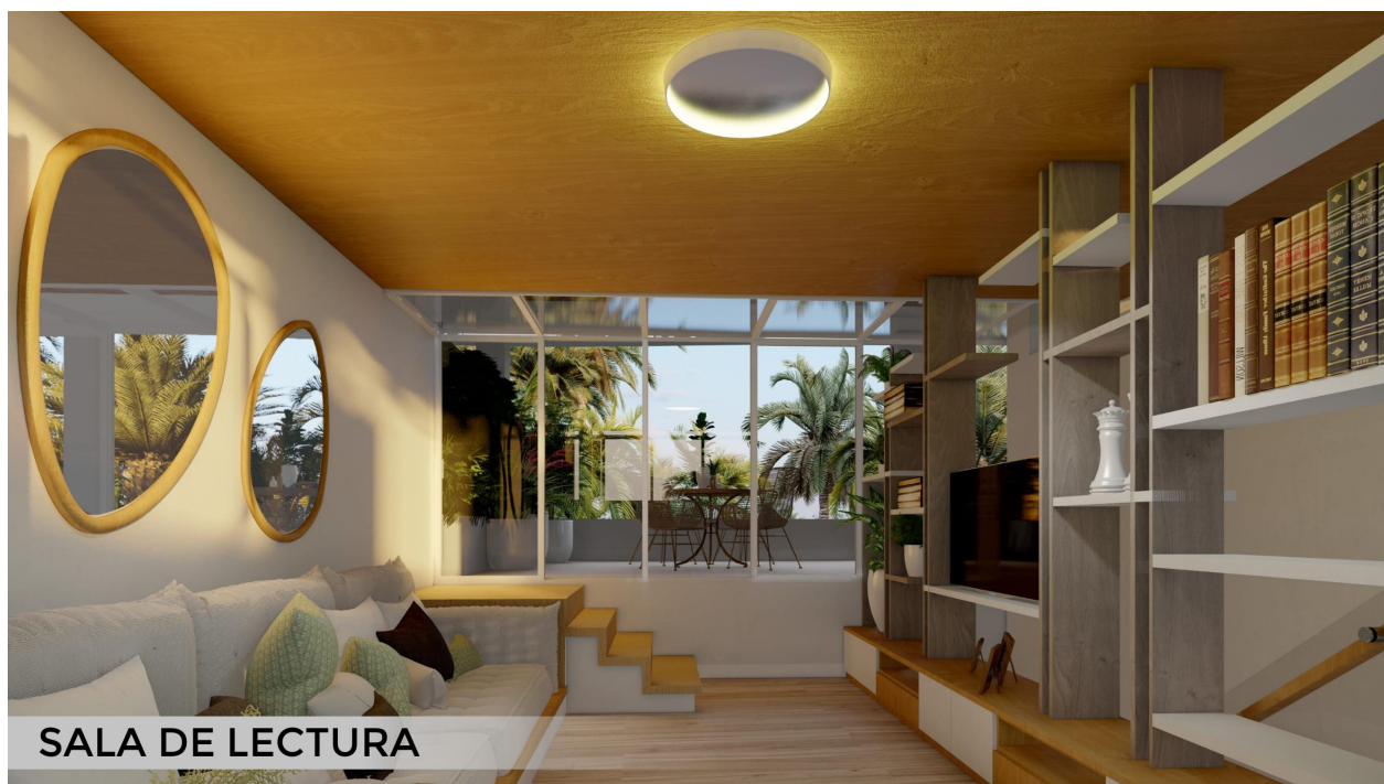
SALA DE LECTURA