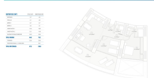
Tipología: 2 dormitorios