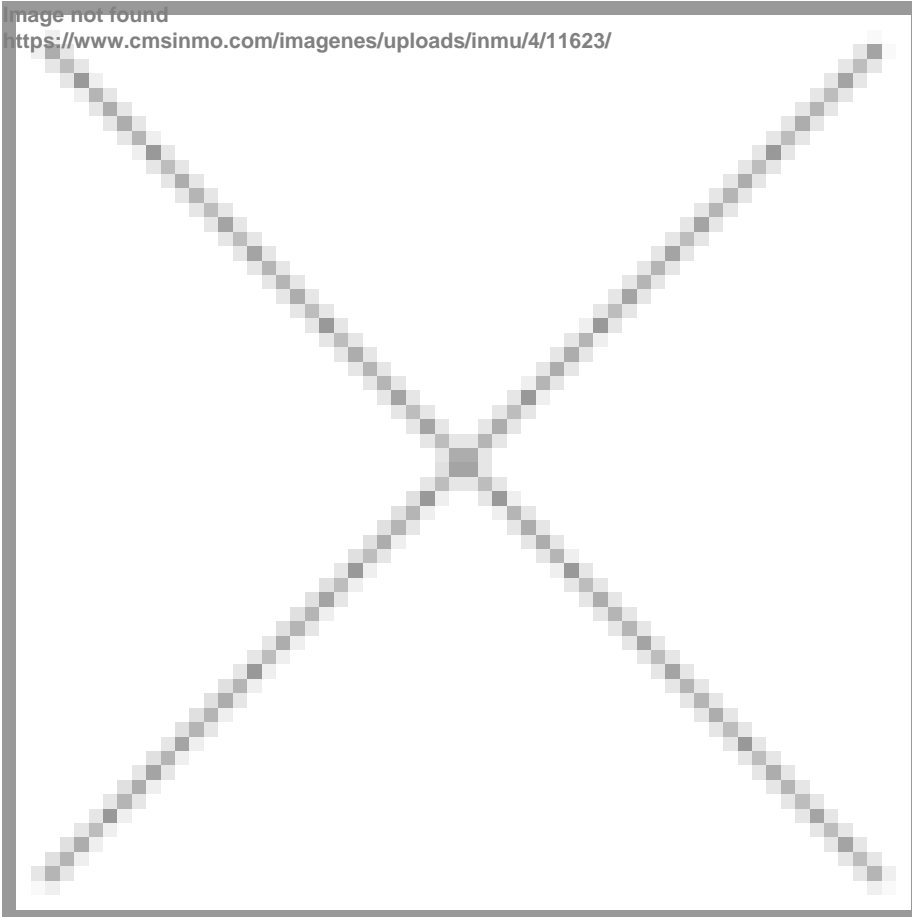
Image not found https://www.cmsinmo.com/imagenes/uploads/inmu/4/11623/