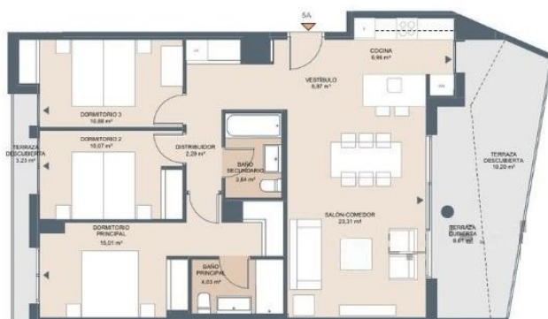
Esc. 2 P05-A