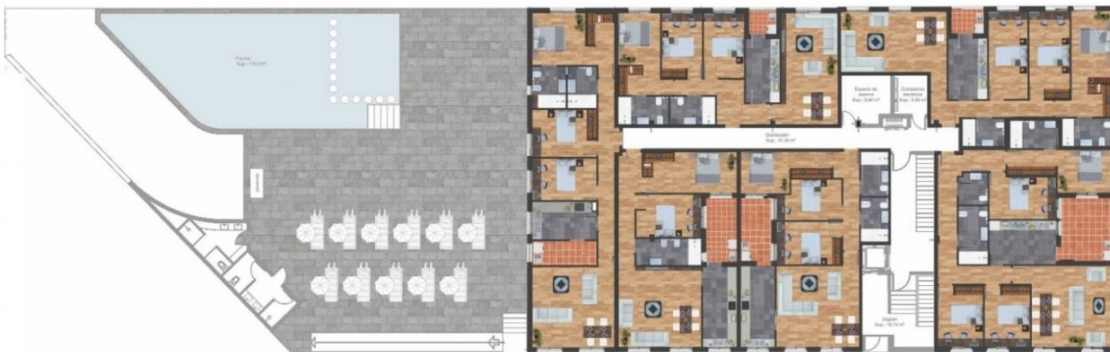
VIVIENDA PLANTA BAJA. MODELO 03