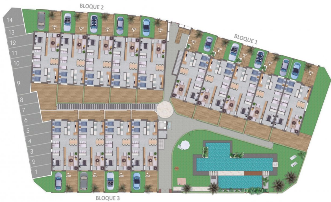
Planta Baja / Ground Floor