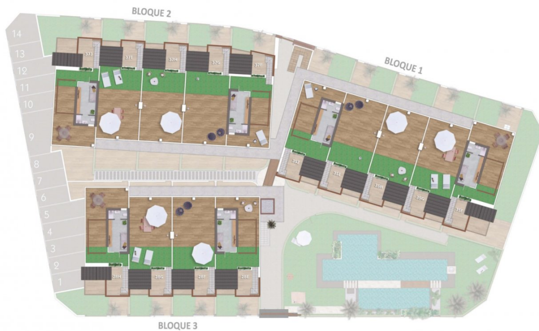
Planta Solarium / Topfloor