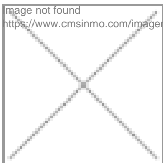
image not found https://www.cmsinmo.com/imagenes/uploads/inmu/5/7706/IMG_7597.JPG