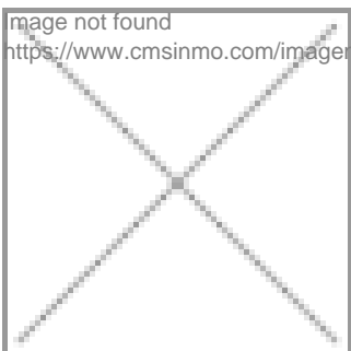
image not found https://www.cmsinmo.com/imagenes/uploads/inmu/5/7706/IMG_7597.JPG