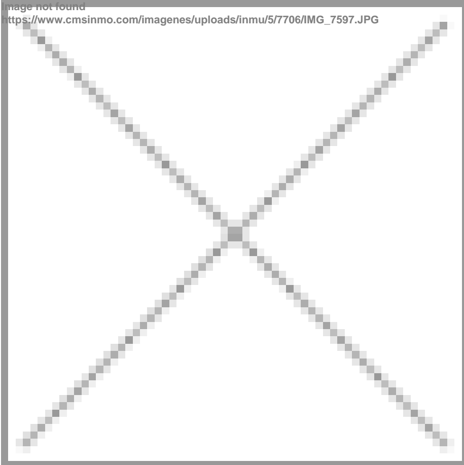
image not found https://www.cmsinmo.com/imagenes/uploads/inmu/5/7706/IMG_7597.JPG